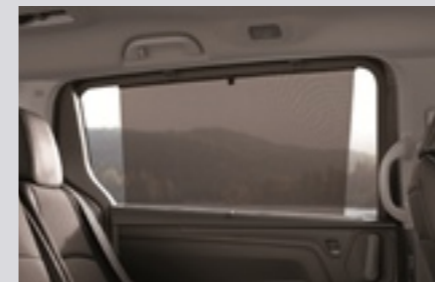
2열 & 3열 윈도우 선쉐이드