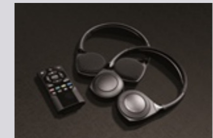
무선 리모컨 & 무선 헤드폰(2 Set)