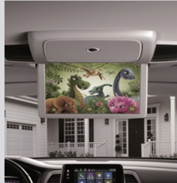
리어 엔터테인먼트 시스템

※ 상기 이미지는 이해를 돕기 위한 가상 이미지로 실제와 다를 수 있습니다.