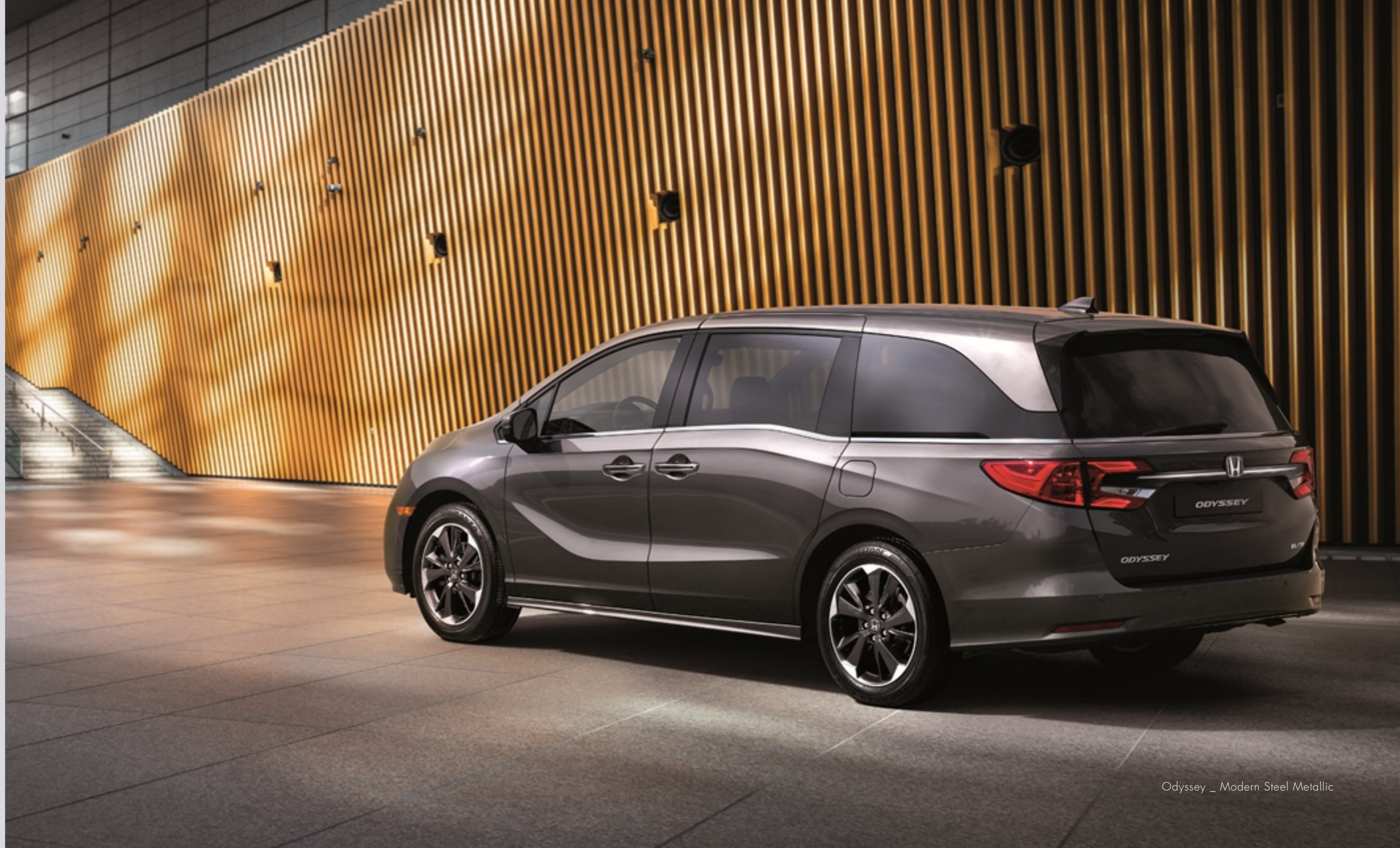
Odyssey _ Modern Steel Metallic