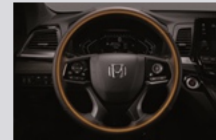
열선 스티어링 휠