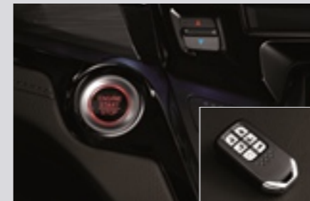
버튼 시동 스마트키 시스템(원격 시동 장치)