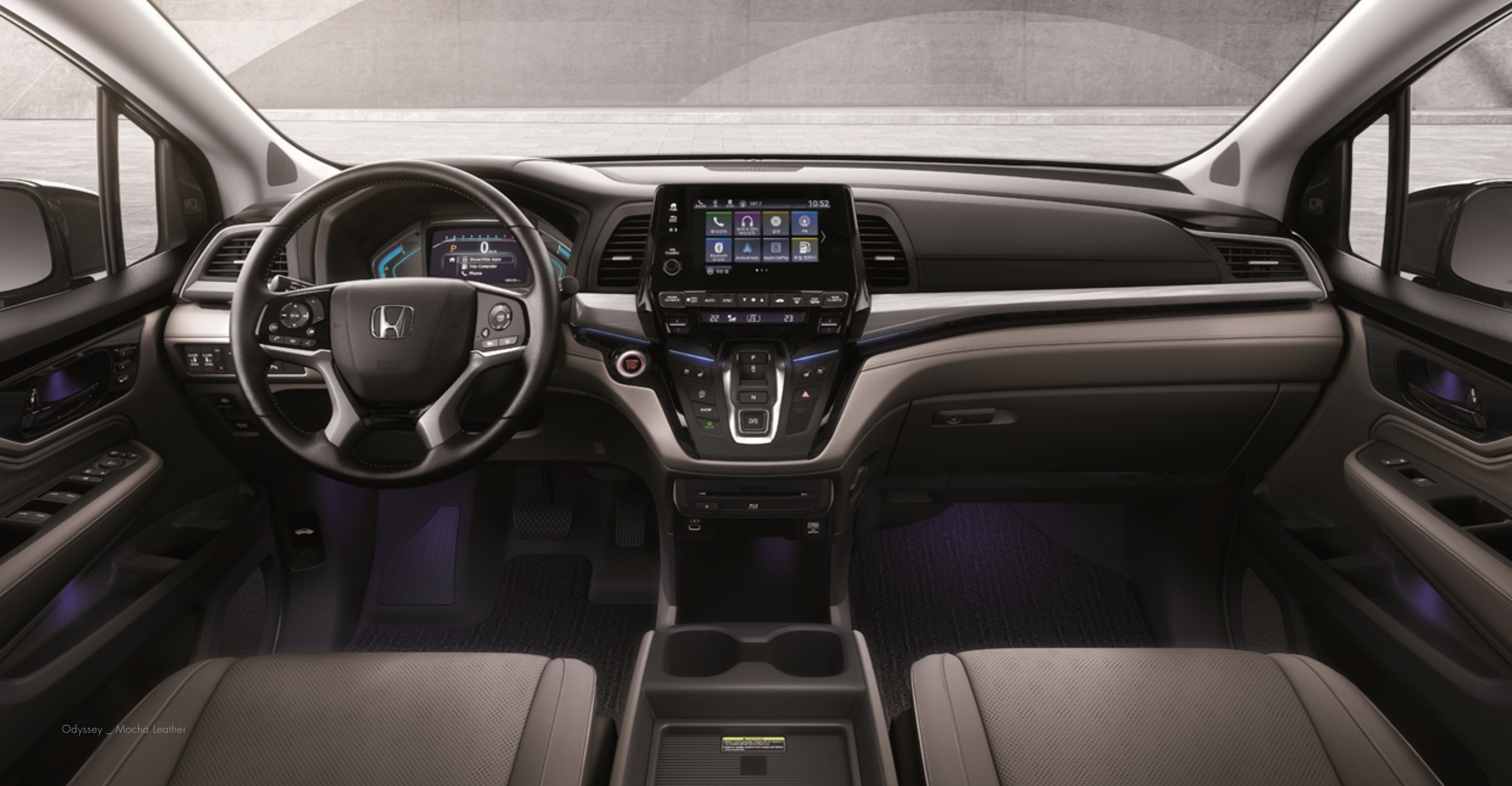
Odyssey _ Mocha Leather