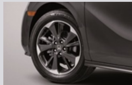
19인치 알로이 휠