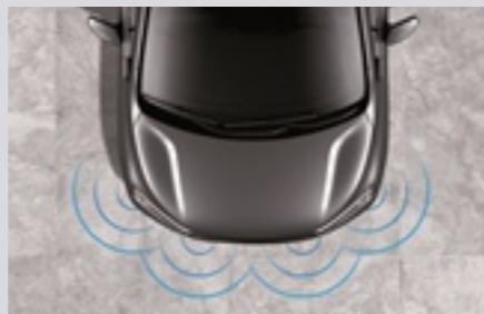
전방 주차 보조 시스템(4센서)