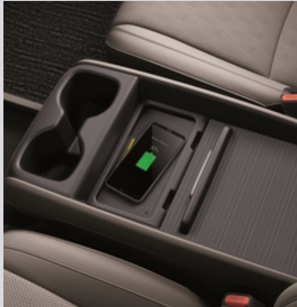
스마트폰 무선 충전 시스템

별도의 유선 케이블 없이 충전 패드 위에 올려놓기만 해도 휴대폰을 충전할 수 있는 편의 기능입니다.