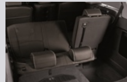
3열 6:4 폴딩 시트