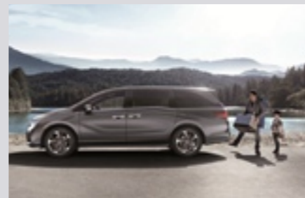
핸즈프리 파워 테일게이트