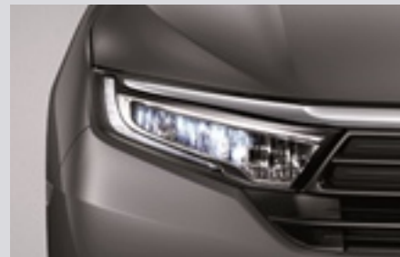
Full LED 헤드램프 & 주간 주행등(DRL)