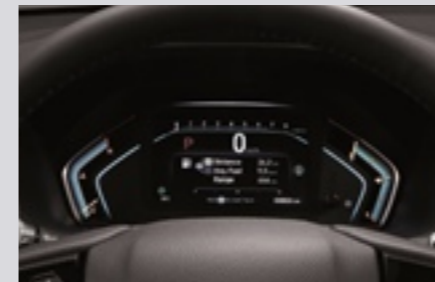
TFT 디지털 계기판