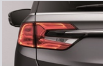
LED 리어 콤비네이션 램프