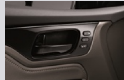
운전석 메모리 시스템