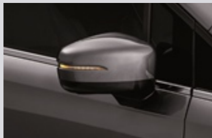
아웃사이드 미러 (LED 턴 시그널/전동 조절/전동 접이/열선 내장/후진 하향/ECM)