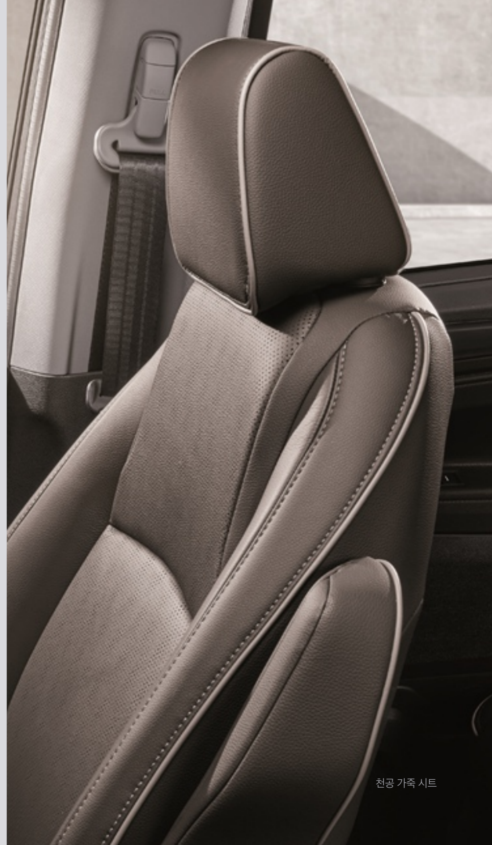
천공 가죽 시트