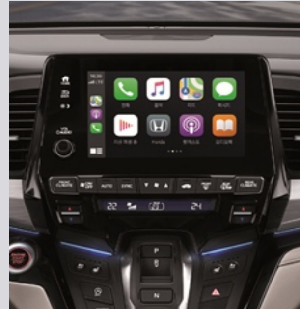
Apple CarPlay / Android Auto

뒷좌석 탑승자를 위한 10.2인치 천장 모니터와 2개의 무선 헤드셋이 제공되며, DVD 재생과 3열에 위치한 오디오 단자를 통해 추가 헤드셋을 사용할 수 있습니다.