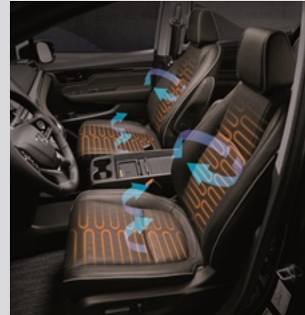
1열 열선 / 통풍 시트

1열 열선 & 통풍 시트가 준비되어 있어 안락하고 쾌적한 실내 환경을 누릴 수 있습니다.