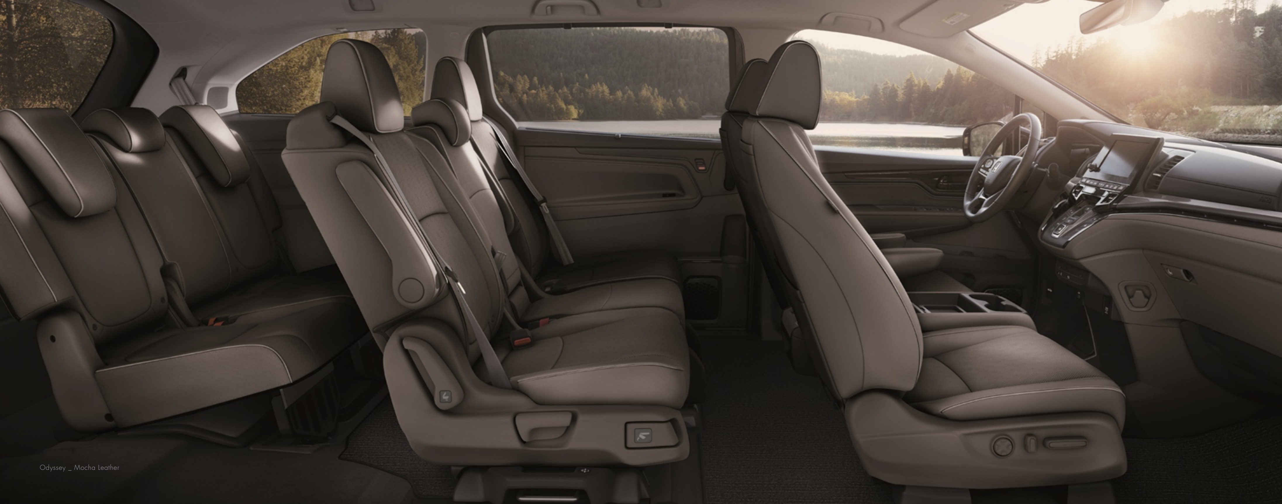
Odyssey _ Mocha Leather