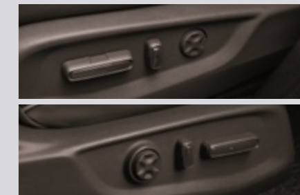
운전석 8방향 파워 시트 & 4방향 러버 서포트 조수석 4방향 파워 시트 & 4방향 러버 서포트