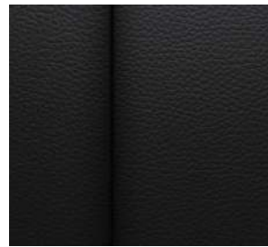
젯 블랙 천연가죽 시트 (LT Leather Premium 전용)