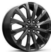
20인치 다크 안드로이드 페인트드 알로이 휠 (RS 전용)