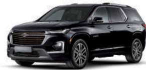
미드나이트 블랙 (GB8)