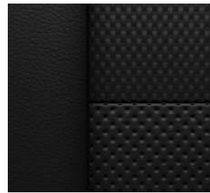
젯 블랙 & 레드 포인트 천연가죽 시트 (RS 전용)