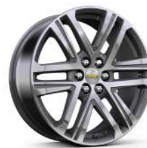
20인치 루나 그레이 머신드 알로이 휠 (High Country 전용)