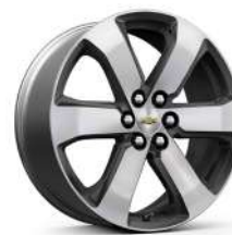
20인치 테크니컬 그레이 포켓 머신드 알로이 휠 (LT Leather Premium 전용)