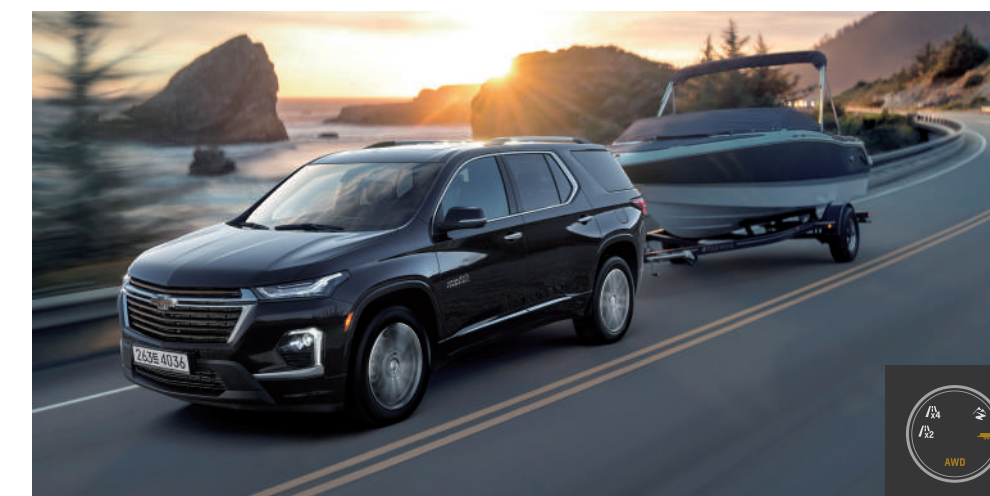
일반도로 주행 시 FWD X2 모드 비나 눈길의 미끄러운 도로 주행 시 AWD X4 모드 비포장 도로의 험로 주행 시 통합 OFFROAD 모드 트레일러나 짐 적재 주행 시 토우/홀(견인/운반) 모드