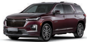
블랙 체리 (GLR)