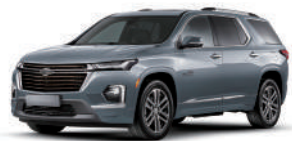
스털링 그레이 (GXD)