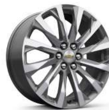
20인치 아전트 메탈릭 머신드 알로이 휠 (Premier 전용)