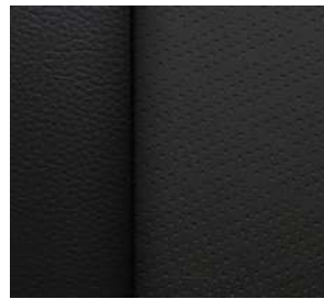
젯블랙 & 클로브 천공 천연가죽 시트 (High Country 전용)