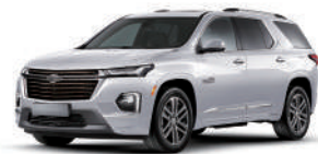
아발론 화이트 펄 (G1W)