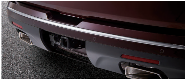
히든 순정 트레일러 히치 리시버 & 미국식 7핀 커넥터 트레일러 히치 가이드 라인 히치 뷰 모니터링

트레일러 연결부를 zoom하여 센터 디스플레이에 보여주는 히치 뷰 모니터링 기능(탑 뷰)은 트레일러 연결 시 쉬운 체결을 도와주며, 주행 중 차량 히치 리시버와 트레일러 연결부의 체결 상황을 실시간으로 볼 수 있습니다.