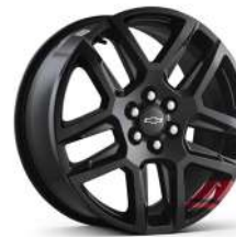
20인치 레드라인 시그니처 블랙 알로이 휠 (Redline 전용)